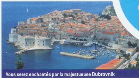
Vous serez enchantés par la majestueuse Dubrovnik