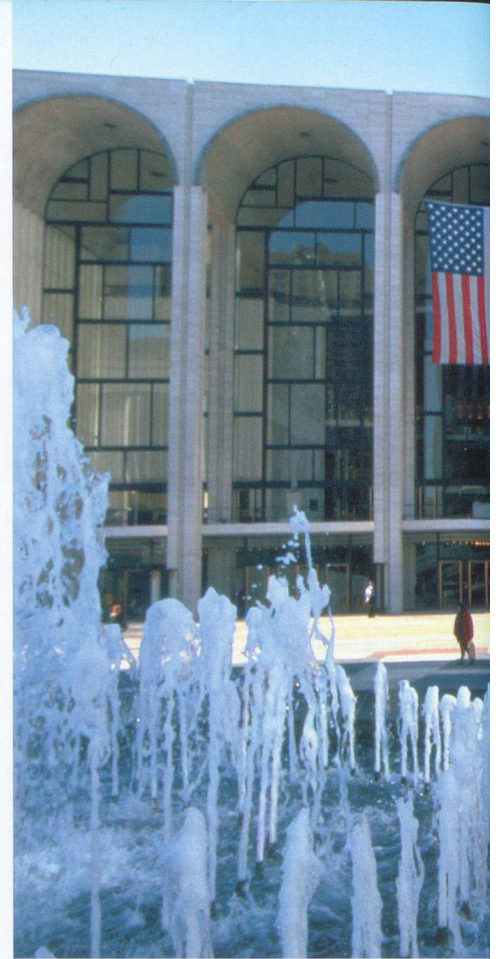
Marthe Keller devant le Metropolitan Opera c