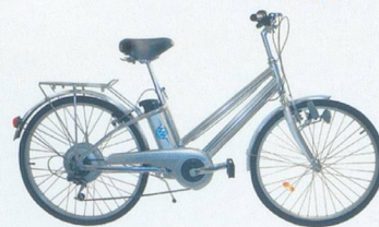
Watt-A-Bike La p'tite reine électrique