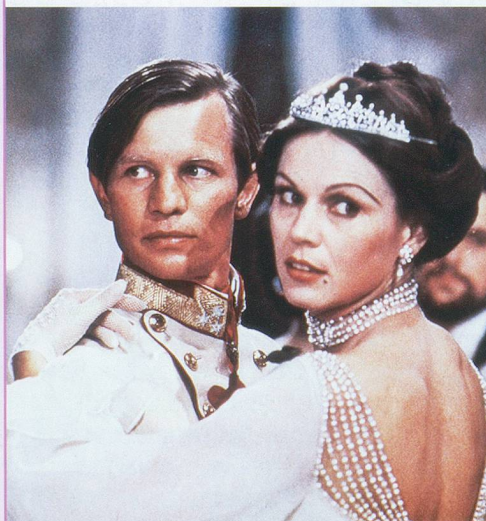
Dans Fedora , avec Michael York.

– Oui, mais si les films avaient été géniaux, je ne serais peut-être pas partie. Ce n'étaient que des films violents qui ne m'intéressaient pas. Comme j'aime faire les cho-