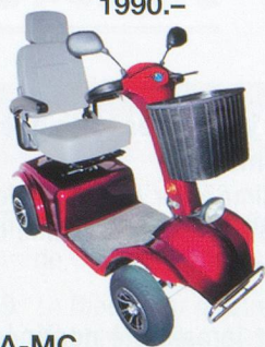
W-A-MC Voiturette électrique