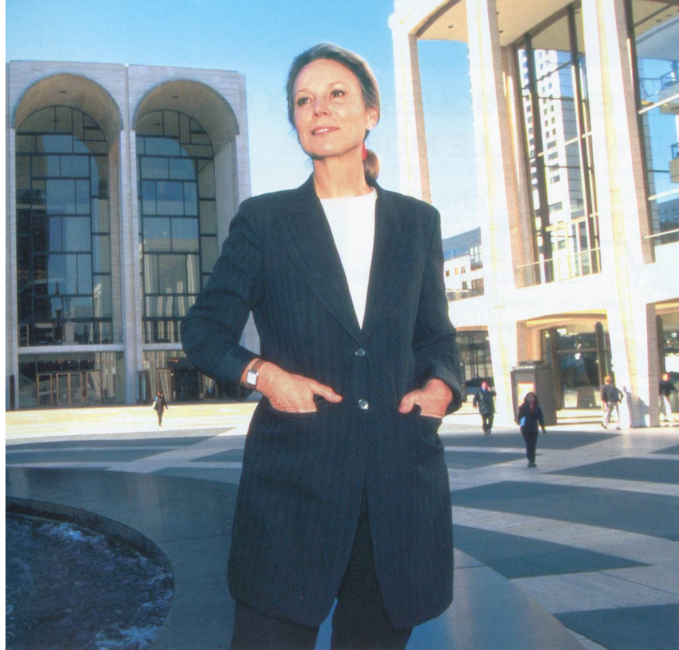
Hervé Le Cumff/RDB