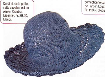
On dirait de la paille, cette capeline est en papier. Création Essentiel. Fr. 29.90, Manor.