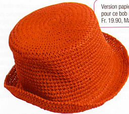
Version papier croché pour ce bob signé Essentiel. Fr. 19.90, Manor.