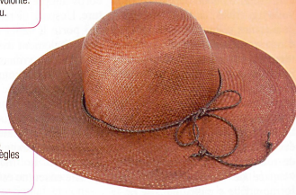
Panama à larges bords, confectionné dans les règles de l'art en Equateur. Fr. 129.-, Globus.