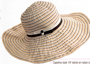
Capeline style 19 e siècle en ruban cousu main 50% coton. Les larges bords cerclés par un léger fil métallique sont modulables. Fr. 120.- au Bon Génie.