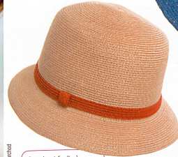
Souple et facile à rouler, ce bob à larges bords doit sa légèreté au chanvre tissé serré. Fr. 89.-, Coup de Chapeau.