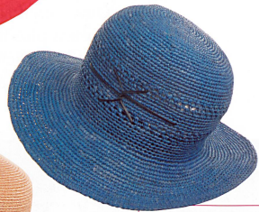
Cette année, le crochet s'impose jusque dans le panama, chapeau mythique entre tous. Fr. 96.-, Coup de Chapeau.