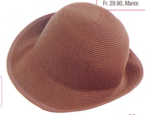
Tout rond, tout mignon... encore un bob en papier, mais celui-là est tissé. Création Essentiel. Fr. 29.90, Manor.