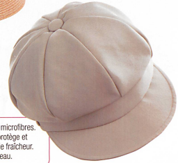
Casquette gavroche en microfibres. Un tissu ultraléger qui protège et laisse une impression de fraîcheur. Fr. 78.-, Coup de Chapeau.