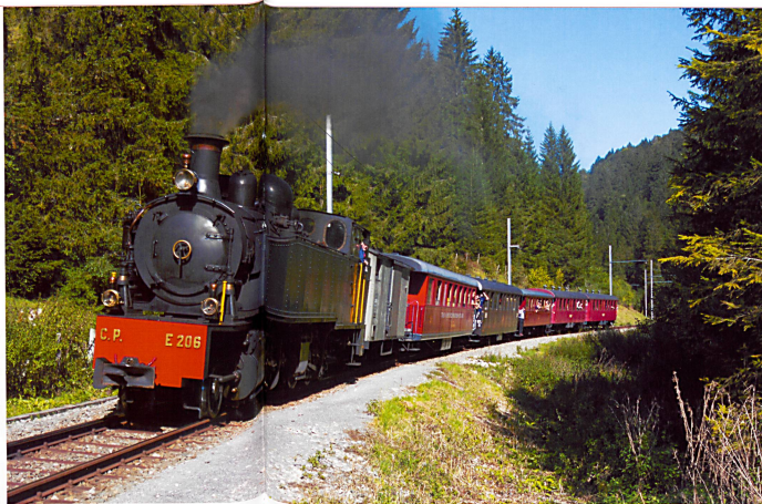
Nostalgie avec le Train à Vapeur des Franches-Montagnes.

jourd'hui encore 85 km de lignes, dont 74 à voie étroite. De 423 m d'altitude (Porrentruy) à 1073 m (Bellevue), les CJ sillonnent essentiellement le haut-plateau franc-montagnard. Leurs compositions rouges, portant une tête de cheval, sont partie intégrante de l'image de ce pays, où ils emploient près de 150 personnes. Au fil des décennies, la compagnie a