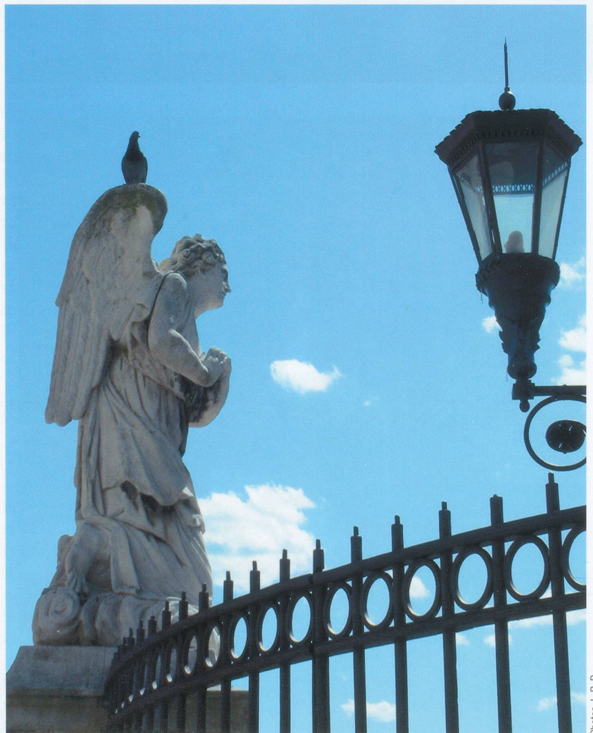
■ Des anges de pierre veillent sur le parvis du Palais des Papes.

fit ensuite d'enjamber le Rhône par le pont Dalladier, pour revenir au cœur de la cité par la porte de l'Oulle et la très coquette place Crillon. ■