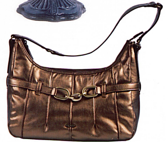
DÉCEMBRE 2007 23

En cuir lamé bronze. Sac Picard, Fr. 79.80, chez Globus.