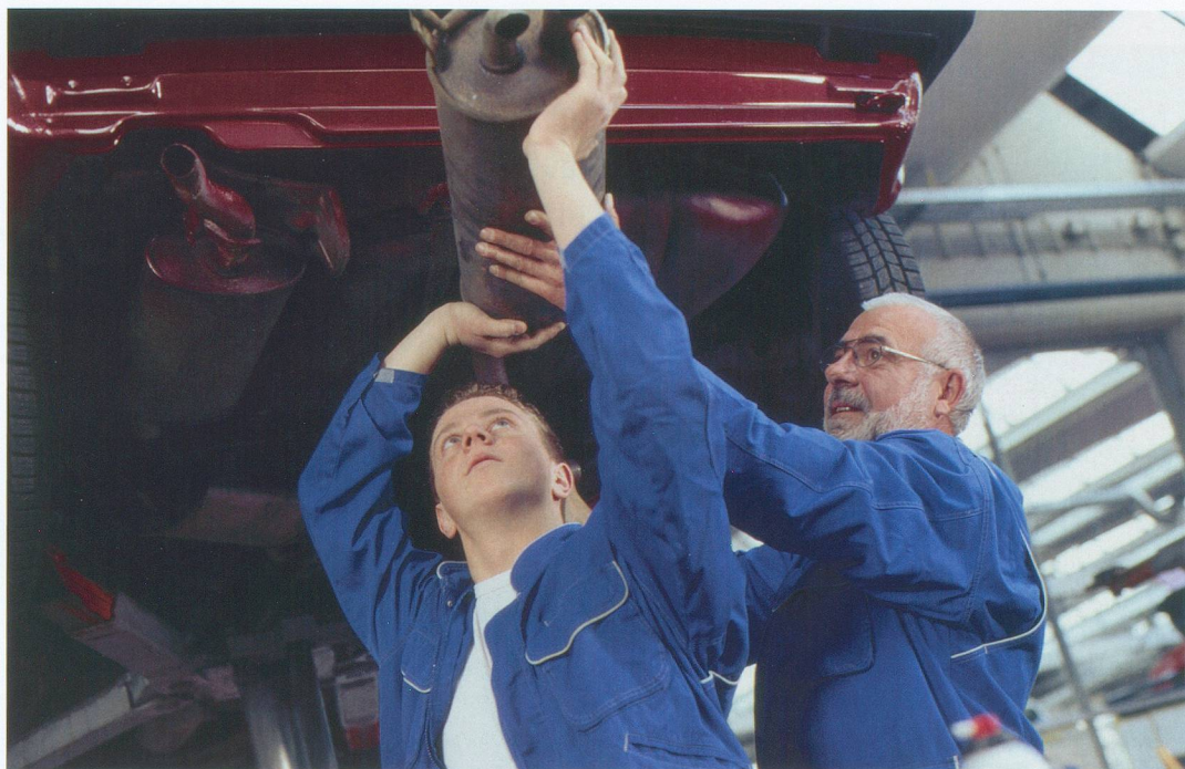
Des seniors vont partager leur expérience professionnelle avec des jeunes en difficulté.

Accompagner des jeunes tout en valorisant des seniors qui ne demandent pas mieux que de transmettre leur savoir et leurs compétences : c'est l'objectif du projet de mentorat que Le Grand-Saconnex va mettre en place.