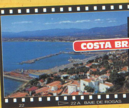
22 22 A BAIE DE ROSAS