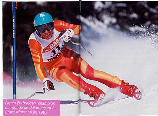
Pirmin Zurbriggen, champion du monde de slalom géant à Crans-Montana en 1987.

— Cela m'a appris que rien n'est facile, qu'on ne peut pas remporter des victoires sans effort, du jour au lendemain. Et puis il y a des hauts et des bas. Quand on gagne, on est fier, heureux et, deux jours plus tard, on fait une contre-performance et on se re-