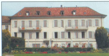
Nouvelle Roseraie – St-Légier (VD) 480 m