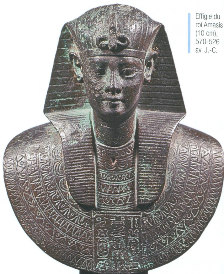
Effigie du roi Amasis (10 cm), 570-526 av. J.-C.