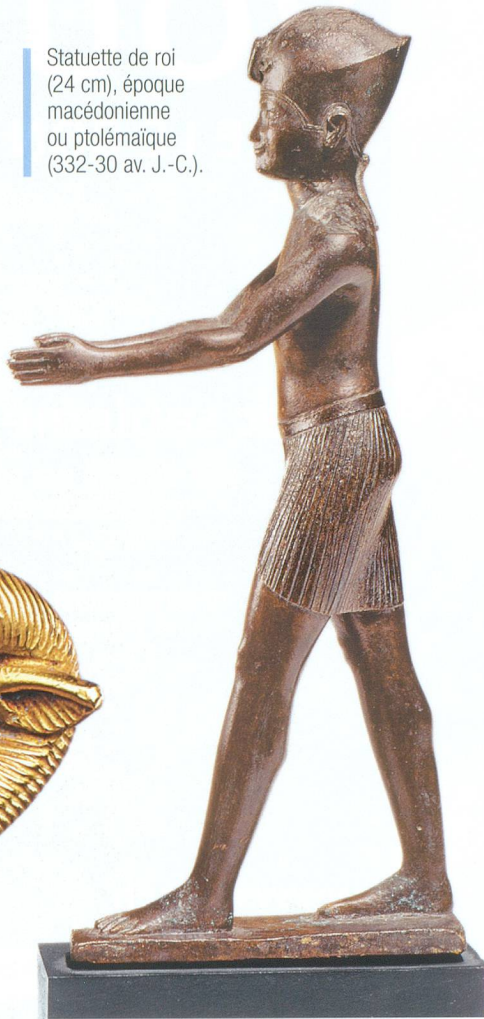
Statuette de roi (24 cm), époque macédonienne ou ptolémaïque (332-30 av. J.-C.).