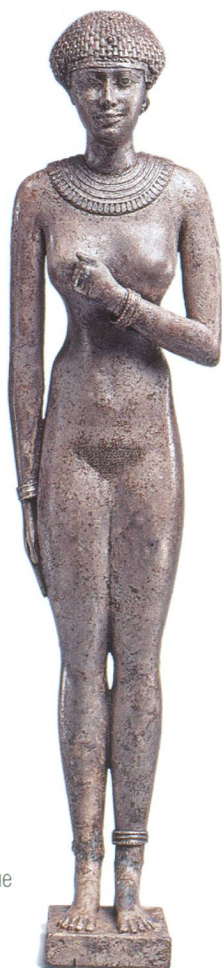
Femme (24 cm) datant de la Basse Époque (610-595 av. J.-C.).

La Fondation Gianadda s'est alliée au Metropolitan Museum de New York pour une prestigieuse exposition de statuaire égyptienne. Les objets proviennent en effet des plus grands musées du monde et sont réunis spécialement à cette occasion.