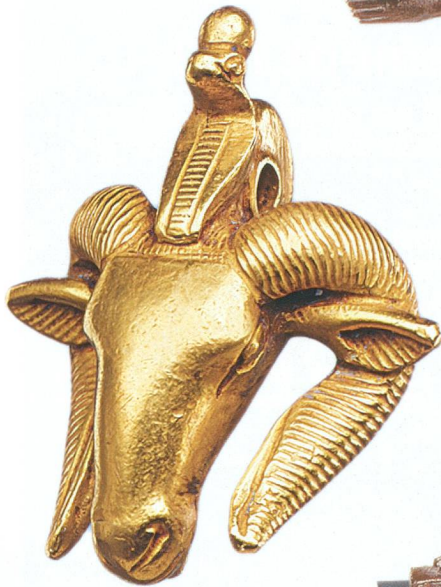
Tête de bélier (4 cm), 747-664 av. J.-C.