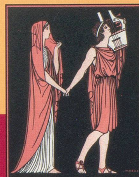
ORPHÉE OPÉRA DE GLUCK THÉÂTRE DU JORAT, MÉZIÈRES (Suisse) JUILLET 1911.

Schweizerische Nationalbibliothek NB Bibliothèque nationale suisse BN Biblioteca nazionale svizzera BN Biblioteca nazionale svizra BN