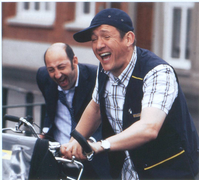
Bienvenue chez les Ch'tis, avec Kad Merad et Dany Boon.

→ dimanche 15 juin. Cité Seniors, 28, rue Amat, 1202 Genève, tél. 0800 18 19 20 (appel gratuit); www.seniors-geneve.ch