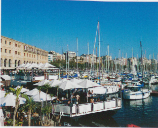
Manquer à Barcelone, au port ou au marché de la Boqueria.