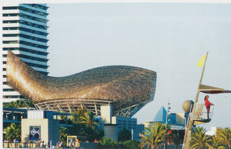
Architecture moderne: Gehry et Nouvel en maestria.