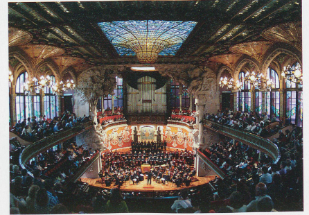
Le Palais de la Musique fête ses 100 ans.

Les fées de l'architecture se sont penchées sur le berceau de Barcelone et l'ont parée des plus admirables réalisations. Gaudi et ses successeurs ont rendu cette cité unique et chatoyante.