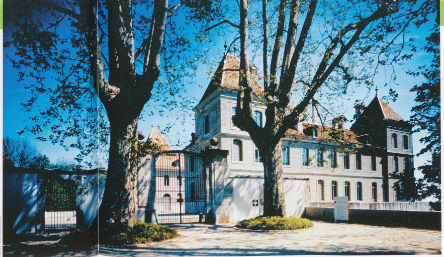
Le domaine de Prangins doit son château à un banquier saint-gallois.

ou quel était le sort des ouvriers qui ont permis au pays d'accéder à l'ère industrielle. Et souvenez-vous de la place accordée alors aux femmes. Sur ce sujet délicat, une toile célèbre de Jean-Elie Dautun intitulée Les Suisses illustres ne laisse planer aucun doute. Le peintre invite 130 hommes fringants dans son panthéon national. Dans un coin discret du tableau, l'artiste esquisse cinq minuscules portraits de femmes sur des médaillons gris et