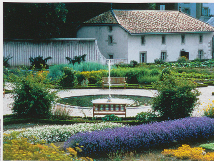
Musées nationaux suisses