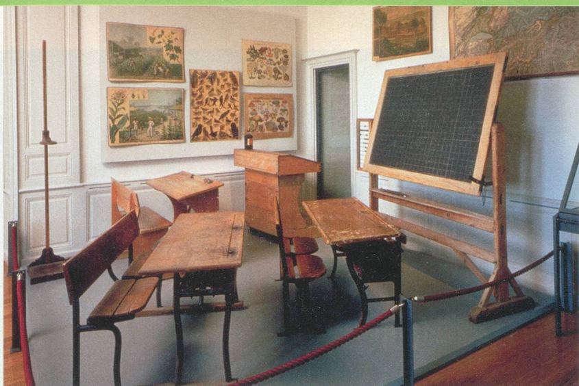
Musées nationaux suisses

Entre 1880 et 1900, de nouvelles écoles sont construites dans tout le pays.