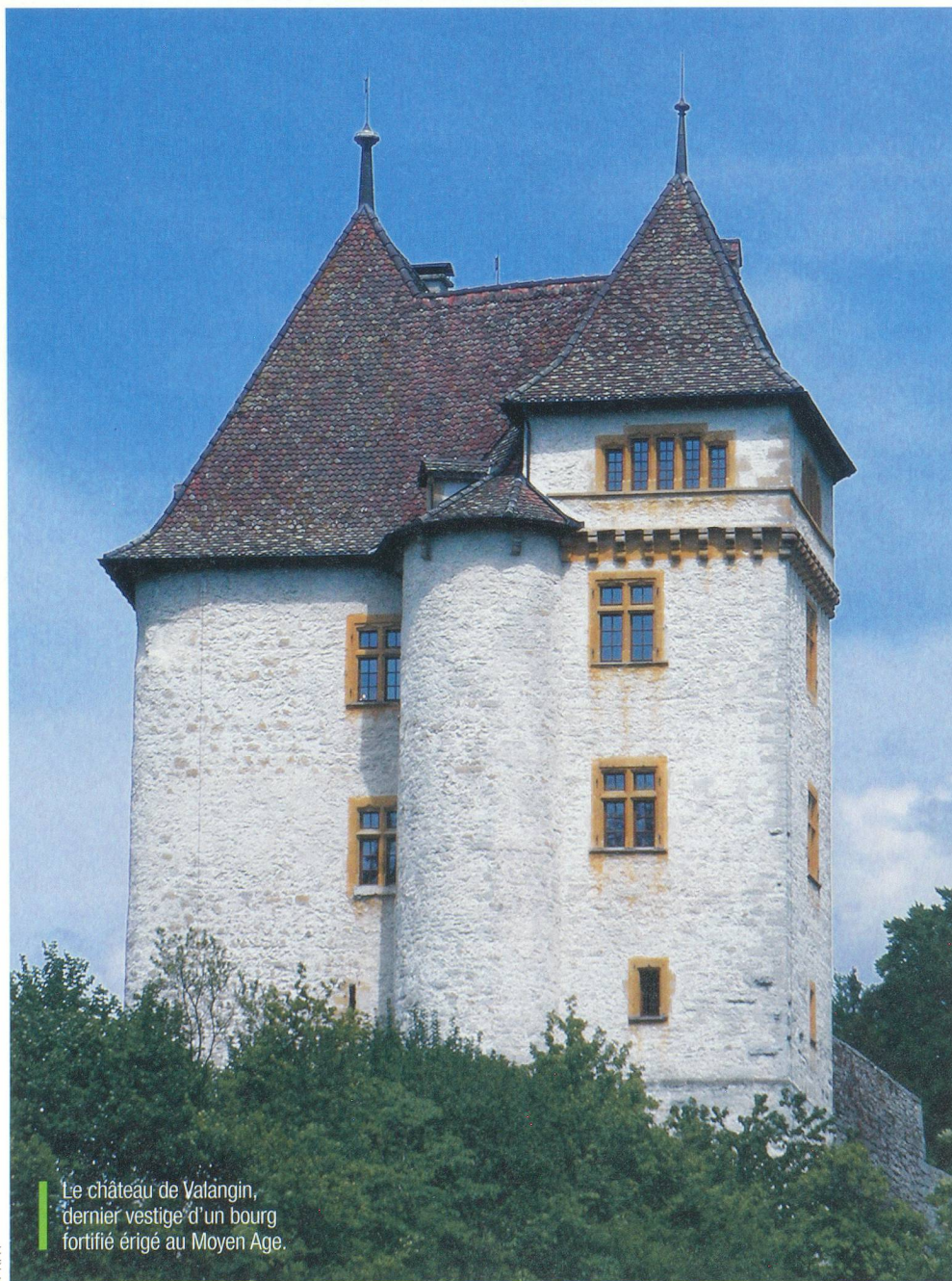
Le château de Valangin, dernier vestige d'un bourg fortifié érigé au Moyen Âge.

Construit sur un éperon rocheux, à l'extrémité du bourg fortifié, le château de Valangin n'aurait pas fait rêvé Walt Disney. Il s'agit d'un énorme donjon flanqué de deux tours datant, sous sa forme actuelle, de 1772. Passé la porte principale, il faut grimper par un chemin qui louvoie entre les ruines de l'ancien édifice. Une porte à serrure électronique barre l'accès aux visiteurs. Pour atteindre le petit bureau d'accueil, on doit montrer patte blanche. Le voyage dans le passé débute par la cuisine. Une vaste cheminée, surmontée d'un tourne broche muni d'un mouvement d'horlogerie, semble espérer un agneau ou une pièce de bœuf depuis la nuit des temps. Les fers à bricelet,