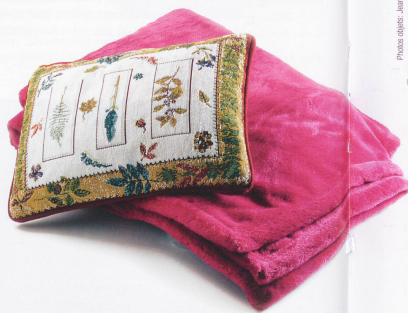
Plaid en laine polaire, couleur fuchsia, Fr. 168.-, Petit coussin (23x33), motif hercier Fr. 29.-, Bovet Tissus SA, rue Centrale 19, Lausanne.

Tout le monde n'a pas la chance d'avoir une cheminée dans son appartement. Mais aujourd'hui, une nouvelle génération de foyers fait son apparition. Sans conduit, sans bois et sans fumée, ces cheminées fonctionnent au bioéthanol, donc une énergie propre et bon marché (env. Fr. 4.90, le litre). Non seulement, ces cheminées sont écologiques et décoratives, car conçues par de grands designers, mais en plus elles chauffent. Elles offrent ainsi une bonne solution de chauffage d'appoint aux entre-saisons. Ce type de cheminée est en outre facile d'utilisation: on l'allume et on l'é-