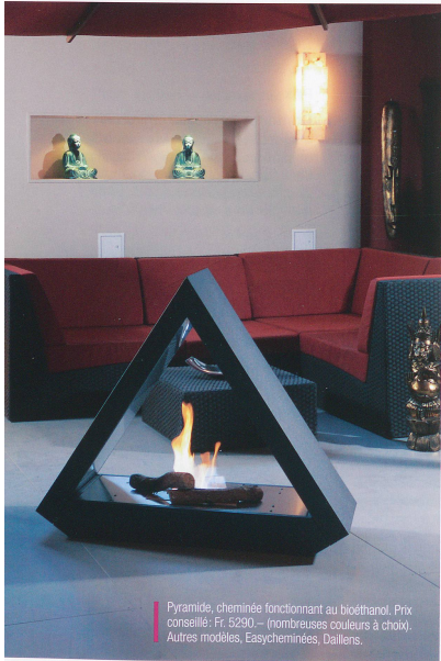
Pyramide, cheminée fonctionnant au bioéthanol. Prix conseillé: Fr. 5290.- (nombreuses couleurs à choix). Autres modèles: Easycheminées, Daillans.