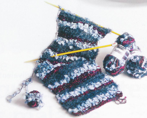
Echarpe à tricoter, Fil polyamide et acryl, Saltado, Schachenmayr nomotta, en vente chez Coop-City, Fr. 6.90