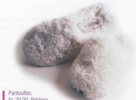
Pantoufles, Fr. 29.90, Beldona.

Pas de doute, novembre s'installe. Les jours deviennent plus courts, les nuits plus froides. On apprécie d'autant plus son chez-soi lorsqu'on s'est créé une atmosphère chaleureuse.