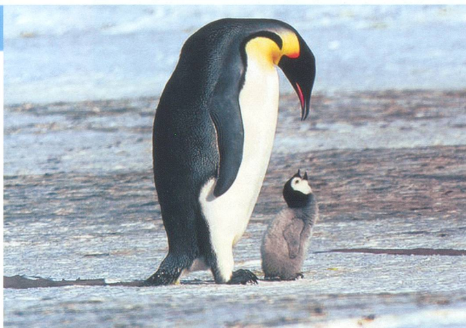
Un manchot et son petit sur la banquise.