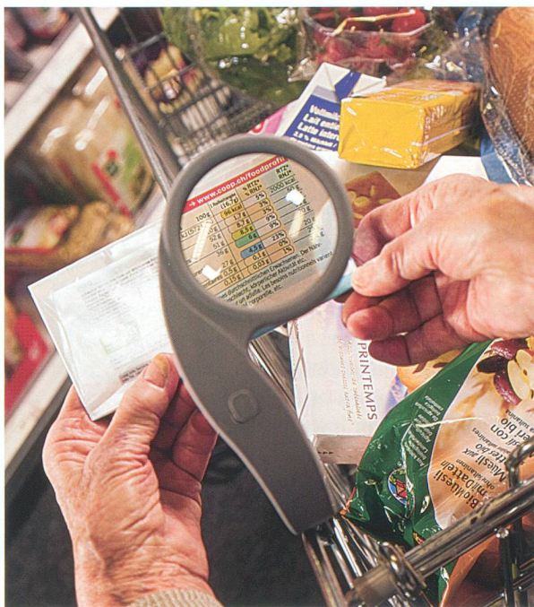
Fini les achats à l'aveuglette: tous les chariots Coop seront bientôt équipés d'une loupe.

Si les tests menés à Crissier sont positifs, les 130 000 chariots que Coop possède partout en Suisse seront équipés d'ici au printemps 2009. A notre connaissance, cette opération originale est une première mondiale. Elle est le fruit d'une nouvelle collaboration récemment développée par le distributeur avec Pro Senectute. ■