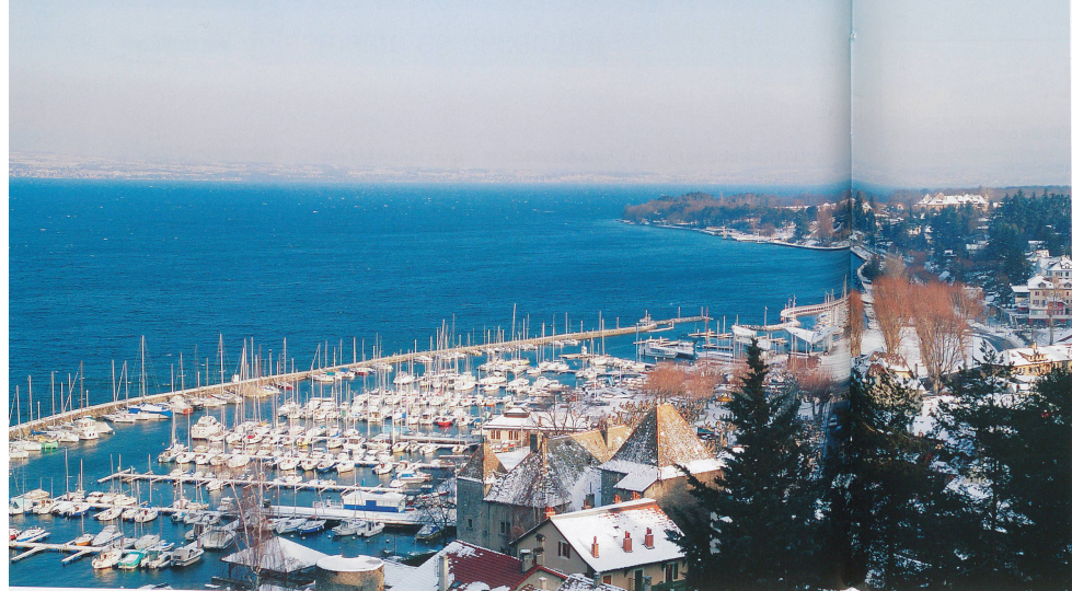
Vue sur le port de plaisance et la rive suisse.

gne – à une prochaine fois. Tout à côté, l'Hôtel de Ville, sur la place du même nom, rappelle par son architecture sarde que les deux Savoie ont longtemps fait partie du royaume de Sardaigne avant d'être rattachées à la France en 1860. Ne manquez pas d'aller jeter un œil sur une façade (à l'ouest de la mairie, en passant sous la plus ancienne porte de la cité) ornée d'un bas-relief représentant des figures grivoises, œuvre vraisemblablement d'un artiste autrichien.