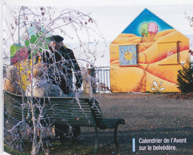
Calendrier de l'Avent sur le belvédère.

deux pas de cette terrasse, l'Office du tourisme a pris ses nouveaux quartiers dans le Château de Sonnaz qui abrite également le Musée du Chablais. Malheureusement, les collections ne sont pas visibles en ce mois de décembre, car le musée est en réfection. Il faudra donc remettre la visite – notamment de la salle consacrée aux objets de contrebande par le lac et la monta-