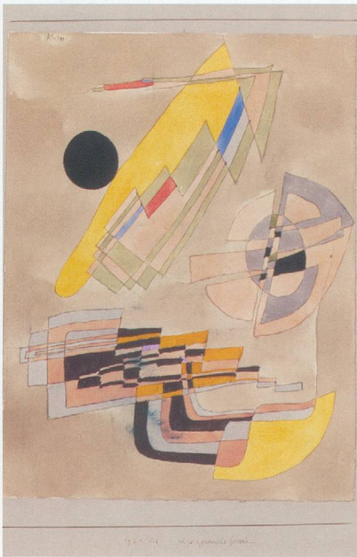
Propriété privée, Zentrum Paul Klee