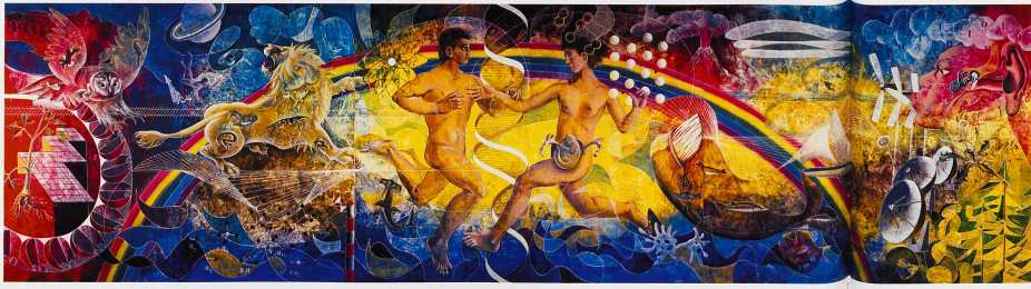
Clean Energy (1999). Cette fresque réalisée pour la Conférence de Genève résume parfaitement le parcours et les idées de l'artiste. On y découvre l'arbre et ses racines, ses animaux fétiches, les fonds marins, les quatre éléments, les progrès techniques. Au centre paraît le couple, avec l'enfant à venir. Le tout étant traversé par un arc-en-ciel porteur d'espoir.