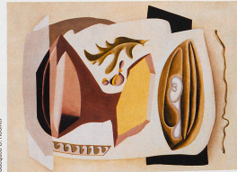
Méandre et Corde (1933). Fortement impressionné par Braque, Picasso et Léger, Hans Erni s'est essayé à l'art abstrait. Il a créé plusieurs œuvres qui ont été exposées à Lucerne sous le thème « Thèse, Antithèse, Synthèse », avant de se tourner vers d'autres formes artistiques.

sident de la Confédération. L'artiste, souriant aux lèvres, répondit : « Regardez mes œuvres, je ne pense pas mentir à travers elles! » Pour fêter ses 100 ans, Hans Erni met la dernière main à une fresque gigantesque de 60 m de long au Palais des Nations à Genève. Le couronnement d'une carrière entière mise au service de l'engagement, de l'espoir et de la tolérance. ■