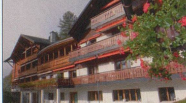
Chalet Florimont – Gryon (VD) 1200 m