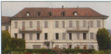
Nouvelle Roseraie – St-Légier (VD) 480 m

Genève , rue de Lausanne 37 (50 m de la Gare) – tél. 022 738 90 11