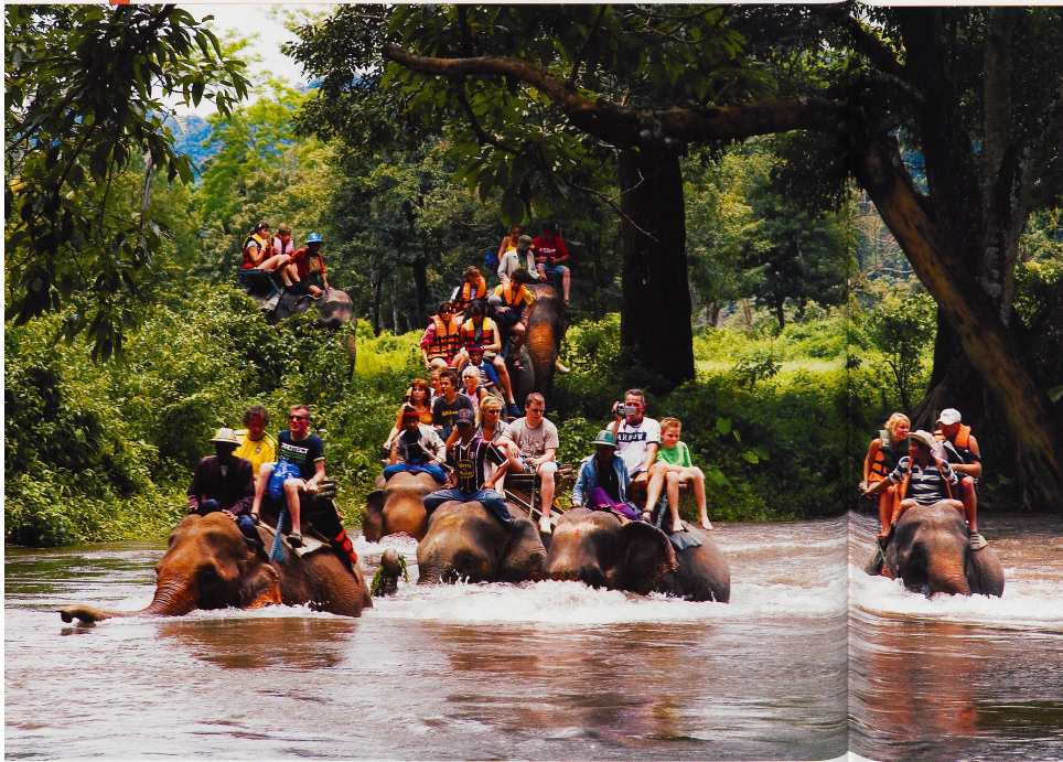
Les promenades à dos d'éléphant permettent d'entrer dans des forêts qui resteraient impénétrables sans leur habileté et leur intelligence.