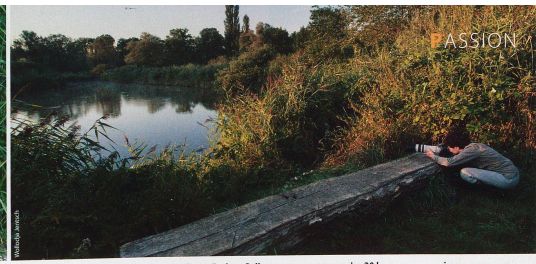
L'observation des oiseaux, un loisir chronophage, Evelyne Pellaton y consacre au moins 20 heures par semaine.