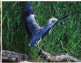
Héron cendré à l'attention. Photo prise dans la réserve naturelle de Champ-Pittet.