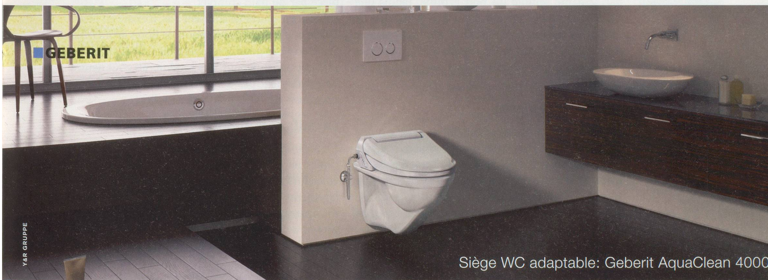
Siège WC adaptable: Geberit AquaClean 4000

On ne peut plus simple pour créer sa propre oasis de bien-être.