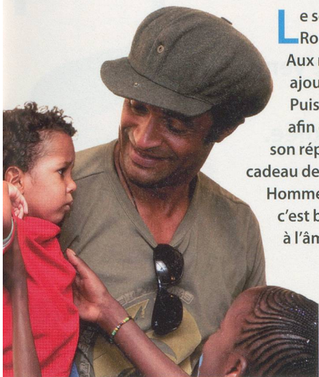
Séverine Rouiller / clind'oeil

L e seul chanteur français à avoir remporté Roland-Garros nous étonnera toujours. Aux rythmes africains et au reggae, il a ajouté les mélopées des Indiens du Chili. Puis il a marié guitares d'ici et de là-bas, afin d'insuffler une touche nouvelle à son répertoire. Fidèle à ses habitudes, il fait cadeau de son nouveau spectacle à Terre des Hommes. Ça s'appelle Charango , ça balance, c'est beau, c'est généreux et ça fait du bien à l'âme.