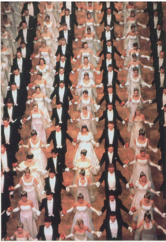
ANTO / Lammerhuber

Capitale d'un empire qui n'existe plus, Vienne en a conservé les fastes et le goût des fêtes. A découvrir entre musique et modernité.