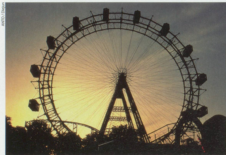
Pour voir Vienne d'en haut: rien de mieux qu'un tour de grande roue au parc du Prater.

Vienne vous tente? Alors partez avec Généralions Plus . Découvrez notre offre de voyage en page 80.