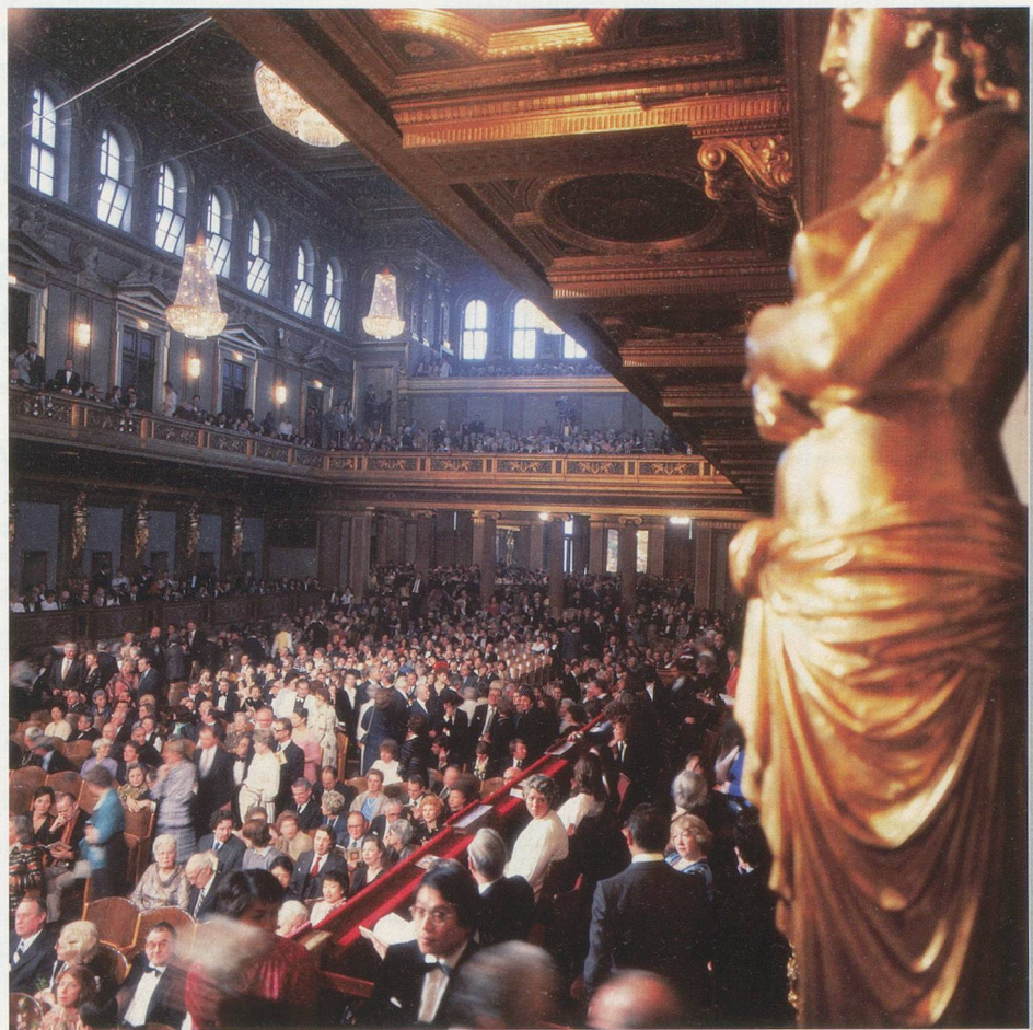
ANTO / Trumier