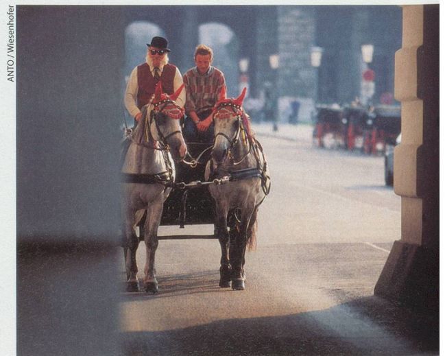
Une promenade en fiacre et nous voilà revenus à l'époque de l'impératrice Sissi