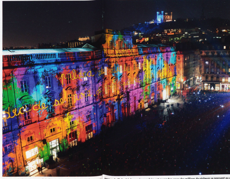
Chaque année, les concepteurs de la fête rivalisent d'imagination et de moyens

Et la légende veut qu'en 1850, l'archevêque de Lyon décide de couronner la chapelle de Four-