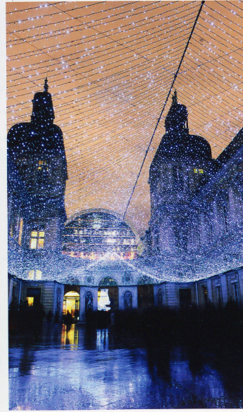
pour embellir la cité. Le succès populaire est au rendez-vous: des millions de visiteurs se pressent au cœur de la nuit. Pour quatre représentations uniques.

En se promenant dans les rues du vieux Lyon, on voit encore ici et là aux fenêtres trembloter les