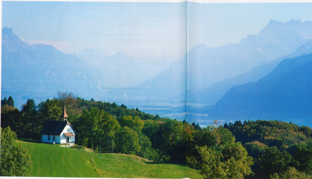
La vue est tout simplement magnifique depuis le Mont-Pèlerin. Alpes, forêts et lac s'entremêlent dans un paysage fantastique.

Tout effort mérite récompense, diront les gourmands. Alors suivez-nous au Mont-Pèlerin. Les promenades sont absolument superbes et le final ne l'est pas moins du côté de Palézieux avec un passage obligé dans la chocolaterie de Mélinda Rost.