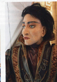
Roméo évidemment, inspiré du personnage de William Shakespeare, romantique et ténébreux.