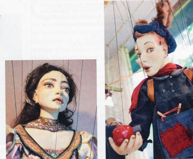
Pinocchio, le célèbre héros du roman de Carlo Collodi (1818), qui gagnera le droit à devenir un vrai petit garçon.