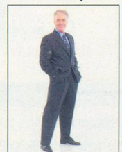
Photo en pied