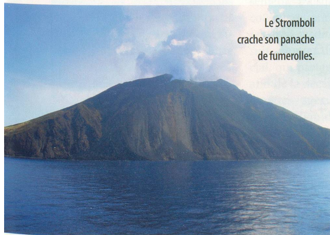
Le Stromboli crache son panache de fumerolles.