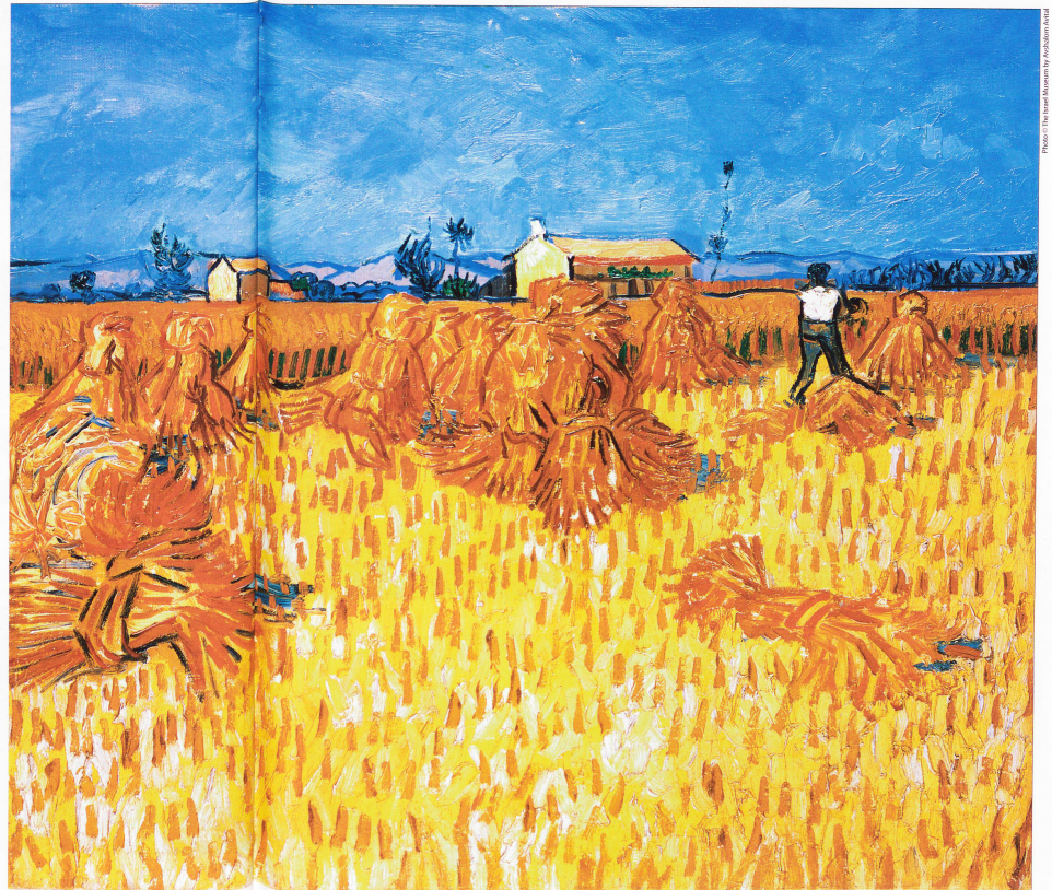
Moissons en Provence

Juin 1888, huile sur toile 50 x 60 cm (Israel Museum, Jérusalem)