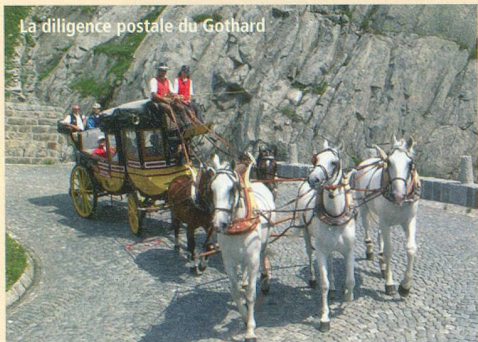
La diligence postale du Gothard

Il y a 500 ans, Leonardo da Vinci, architecte militaire, fit construire une fortification destinée à protéger le «Castello Visconteo» (château Visconti) de Locarno, en tant qu'artiste-peintre, il a laissé d'autres traces au Tessin. Ainsi, nous avons découvert deux copies du célèbre tableau «La Cène», réalisées par des artistes tessinois du vivant du maître. Dans un circuit de 5 jours, vous vivrez de grands moments en découvrant ces merveilles... et bien d'autres choses, en compagnie d'un historien, bien sûr. Pour arriver au Tessin, nous emprunterons la diligence du Gothard... comme au XIX e siècle !