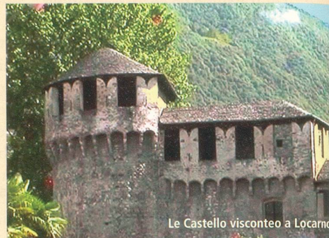
Le Castello visconteo a Locarno

Nous commençons notre programme de la journée par une promenade matinale à la Piazza Grande de Locarno avec ses arcades et ses cafés-terrasses; puis nous rejoignons le « barcadero » pour monter dans le bateau rapide Aliscafo. Nous glissons rapidement sur les eaux du Lago Maggiore vers Stresa et changeons de bateau pour atteindre l'Isola Bella ainsi nommée en mémoire d'Isabella d'Adda, l'épouse de Carlo III Borromeo. L'île, d'origine rocheuse, a aujourd'hui la forme d'un bateau : le château s'avance comme une proue dans le lac, alors que les jardins en terrasses représentent la poupe du navire.