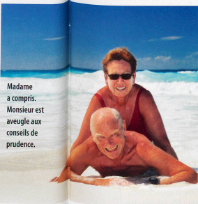
Madame à compris. Monsieur est aveugle aux conseils de prudence.