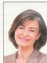
10 x 15 cm