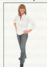
10 x 15 cm