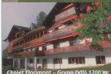
Chalet Florimont - Gryon (VD) 1200 m