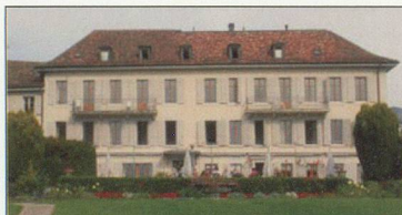
Nouvelle Roseraie - St-Légier (VD) 480 m