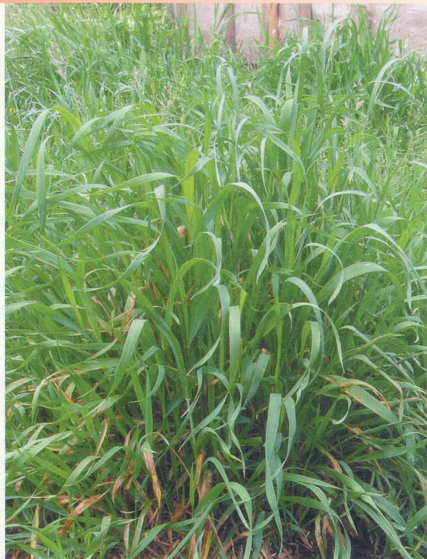
Les apparences sont trompeuses, le chiendent n'a rien d'une mauvaise herbe. Au contraire...

Cette plante rampante n'a pas d'allure. Mais elle possède des vertus multiples, notamment pour purger son organisme.