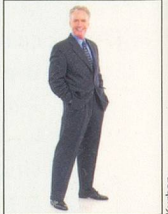
10 x 15 cm