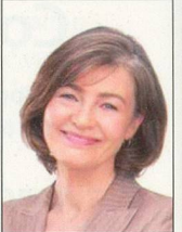
10 x 15 cm