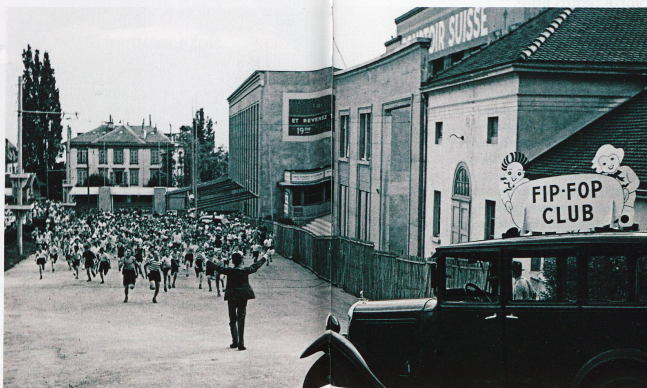
Des centaines d'enfants attendaient avec impatience les séances du Fip Fop, comme ici au Comptoir suisse à Lausanne en 1938. A l'entracte, tout le monde partait à la bourse aux vignettes pour compléter sa collection.

En 1921 sortait le premier album sur le thème des Timbres du