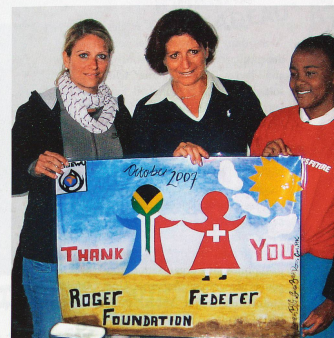
Roger Federer Foundation

Quand Roger se promène à Bâle ou à Zurich, les gens bien sûr le reconnaissent, ils lui sourient, éventuellement le saluent, mais ils le respectent et le laissent en paix. Je suis sûre que quand sa carrière sera finie, il pourra mener une vie plus sereine, plus normale. Ses enfants pourront aller à l'école tranquille-