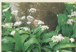
L'ail des ours