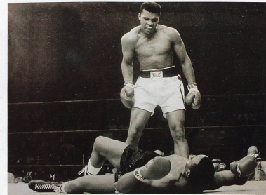
En 1965, lors de la revanche contre Sonny Liston, Mohamed Ali, qui était encore Cassius Clay pour l'état civil, étale son adversaire au premier round avec un direct du droit.

On le croit fini, en 1974, quand il signe son chef-d'œuvre. Dans la nuit moite de Kinshasa, sur le sol de ses ancêtres, il s'adosse aux cordes, se protège la tête et les flancs, laissant George Foreman le matraquer