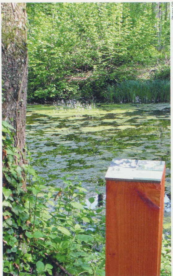
Avec cette promenade balisée qui varie selon les floraisons, les amateurs découvrent des panneaux explicatifs sur les plantes et leurs associations avec nos états émotionnels.