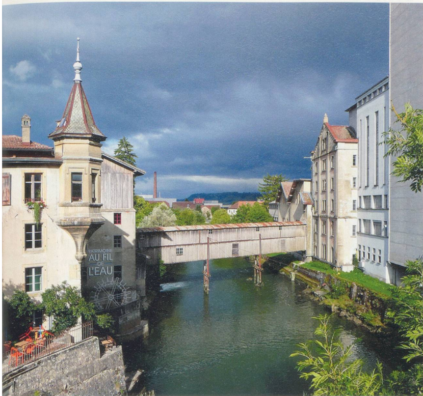
Dans les années 1960, la minoterie comptait encore 170 employés. Aujourd'hui, elle abrite un musée passionnant qui retrace aussi l'histoire de la région.