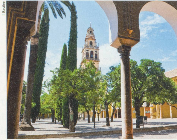
Les orangers et les cyprès procurent un peu d'ombre dans la cour de la Mezquita de Cordoue.