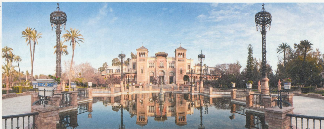
A Séville, le bâtiment du Musée des arts est lui-même un bijou architectural.