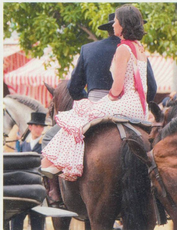
Calèches, flamenco et belles sur un cheval, tout le folklore de la région se laisse admirer par les touristes.