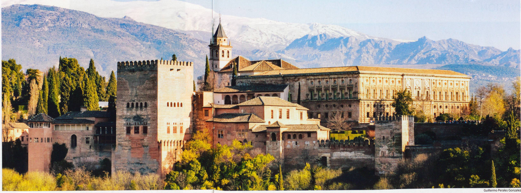
L'Alhambra de Grenade est construit sur un éperon rocheux, avec pour toile de fond les sommets enneigés de la Sierra Nevada.

L'époque où la péninsule Ibérique se faisait appeler Al-Andalus est révolue depuis 1492. Pourtant, les sept siècles de domination musulmane ont laissé des traces dans l'architecture de Grenade, Cordoue et Séville.