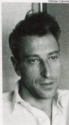
Nicolas de Staël, Paris, juillet 1954

S'il a bénéficié de la « mode des peintres abstraits » après la Seconde Guerre mondiale pour entrer dans les plus grandes galeries du monde, Nicolas de Staël a toujours ré-