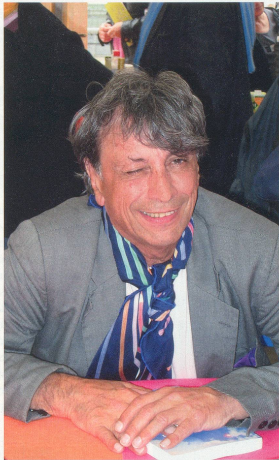
Le chanteur le dit sans détour: son image, il s'en moque. En revanche, il avoue le plus grand respect pour son métier et son public.