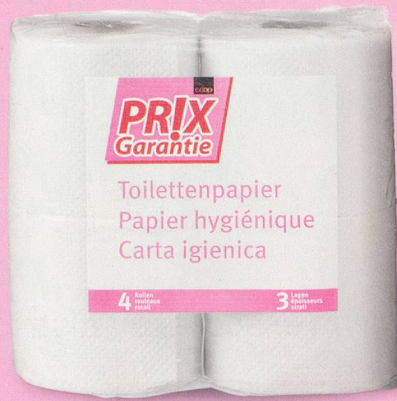
Papier hygiénique Coop Prix Garantie 4 rouleaux fr. 1.25