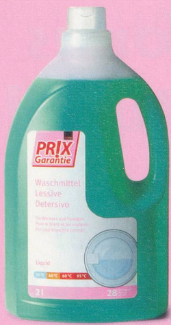
Lessive Coop Prix Garantie 2 litres fr. 4.30