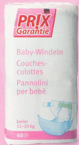
Couches-culottes Junior Coop Prix Garantie 40 pièces fr. 9.55