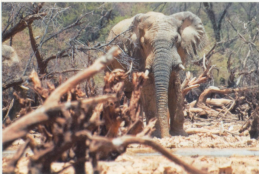
Très peu de gens sont au courant et encore moins les ont vus, mais près de 350 éléphants sillonnent les forêts d'épineux entre le Burkina Faso et le Mali.

Comme celle du pays Dogon, cette peuplade se compose essentiellement d'agriculteurs et vit hors du temps sur les falaises de Bandiagara. Michel Drachous-